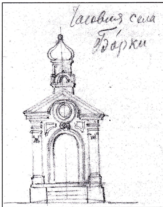
Часовня села Борки Рязанского уезда.

На документе стоит резолюция владыки Симона (Лагова): «Показанную перестройку учинить Благословением от сего года консистории рассмотря, дать Указ, или как вся церковь возымеет возобновляться, то написать грамоту, представить и подписать. 1783 года, апреля 4 дня» 3 . Епархиальным начальством предписывалось «престол построить по указанной мере, а именно, в вышину аршину шести вершков,