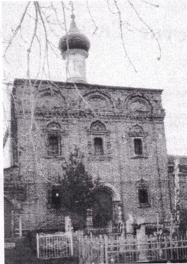
Храм Богоявления Господня в селе Борки (г. Рязань)

совершенным 2 февраля этого года. За ними угадывается богатое историческое наследие. Читаем: «Сохранивший-